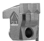
Dente Lateral C/3/SS