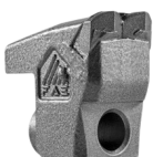
Dente Tipo C/3

Os dados referem-se à máquina como padrão. Os dados técnicos deste catálogo podem ser alterados sem prévio aviso.